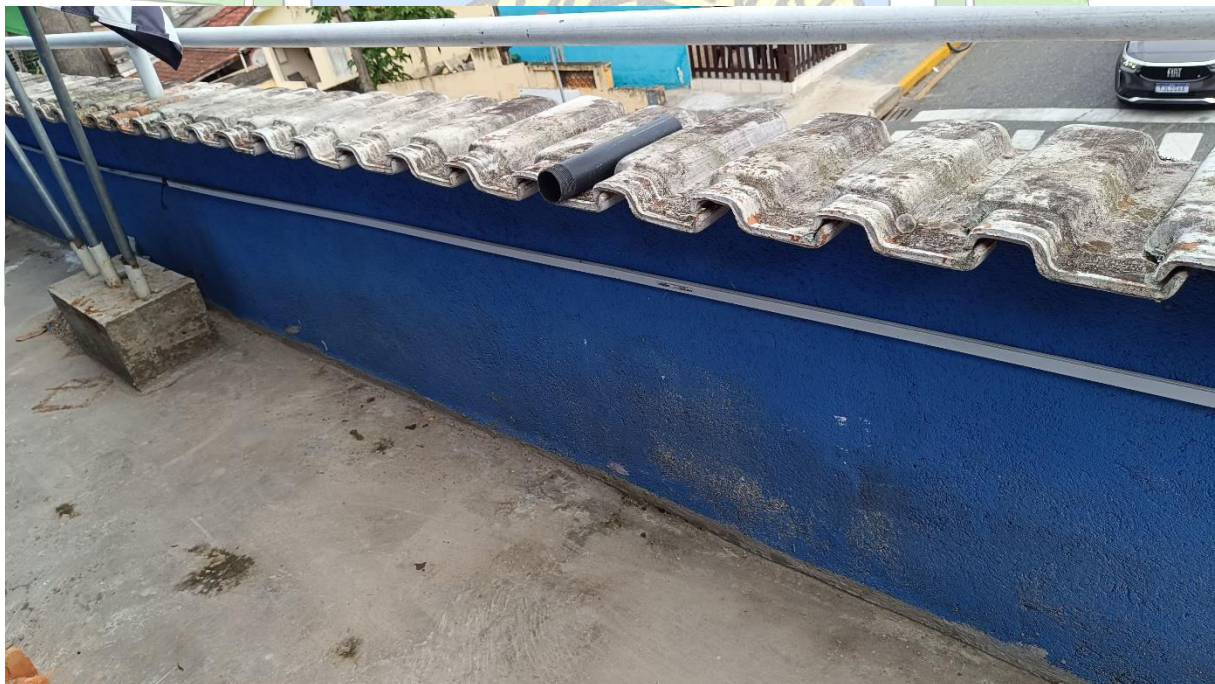
Imagem 4 - Área externa (marquise)