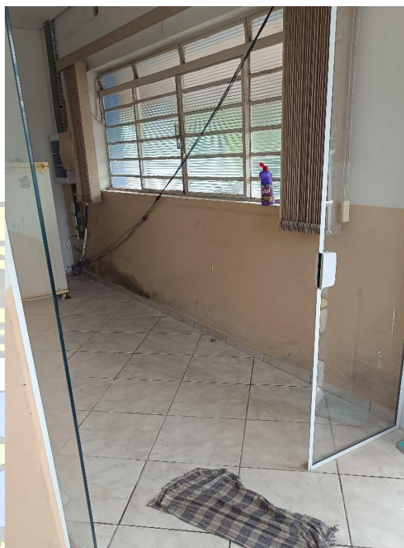
Imagem 9 – Área interna piso superior e janela