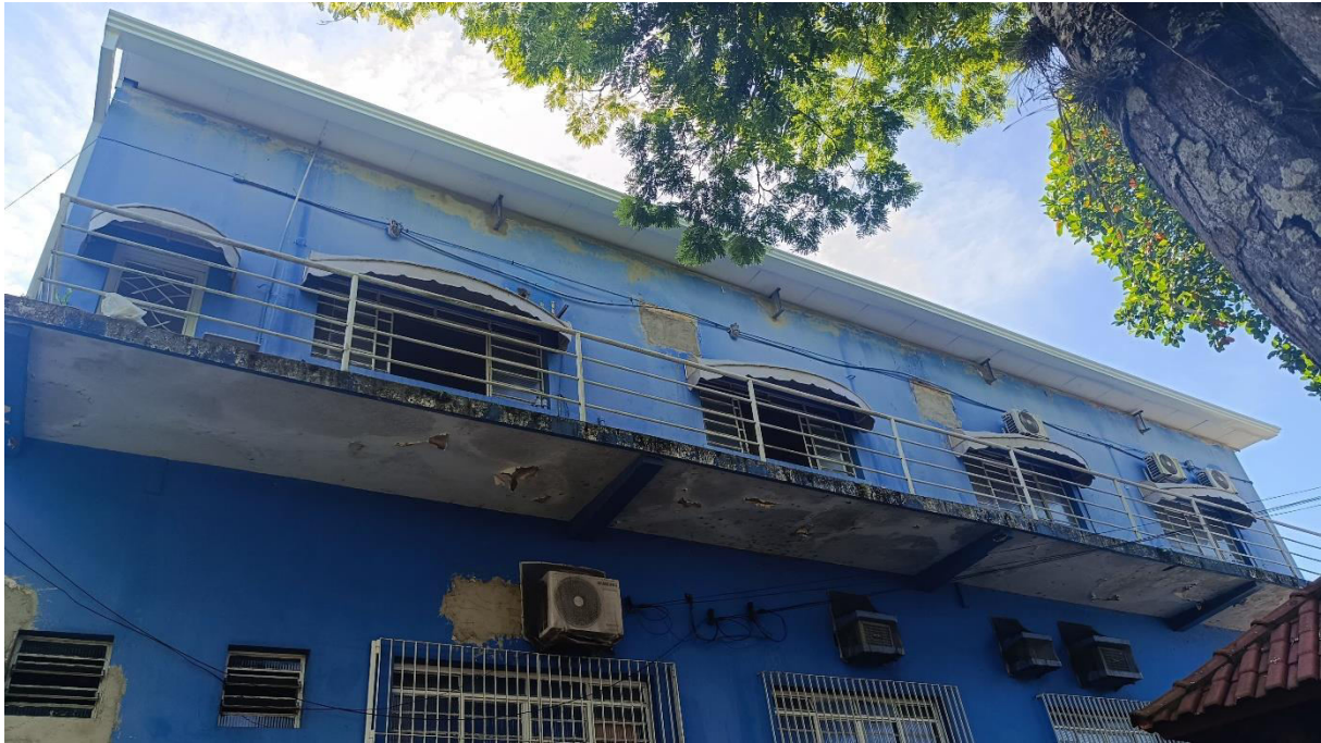
Imagem 1 – Área externa lateral e marquise