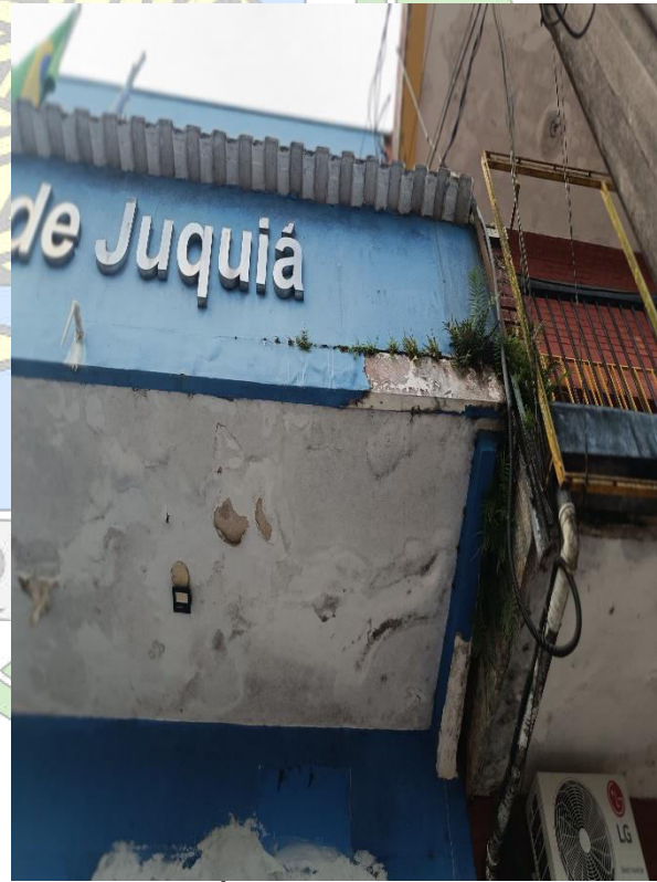
Imagem 7- Área externa frontal (marquise)