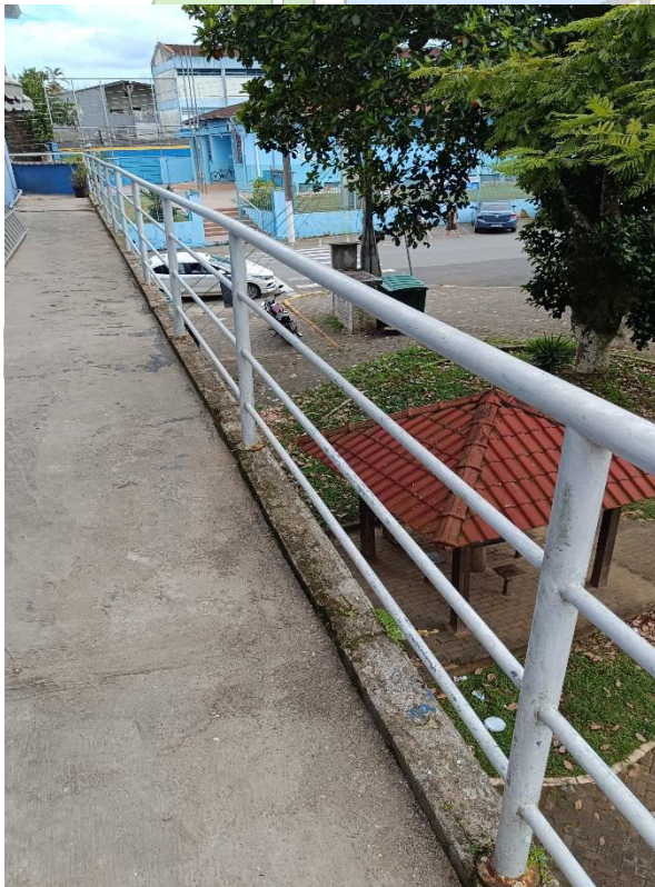
Imagem 6 - Área externa (marquise e guarda-corpo)