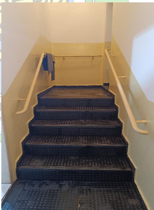
Imagem 11 – Área interna (escada)