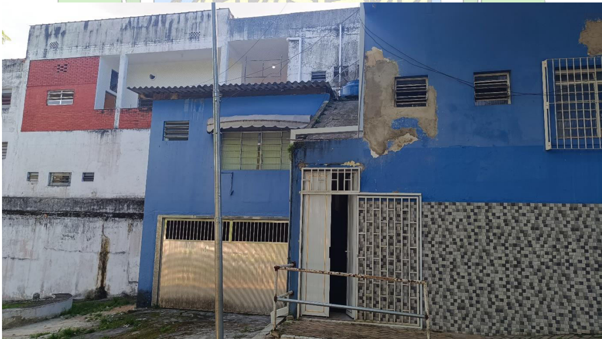
Imagem 2 - Área externa lateral e garagem