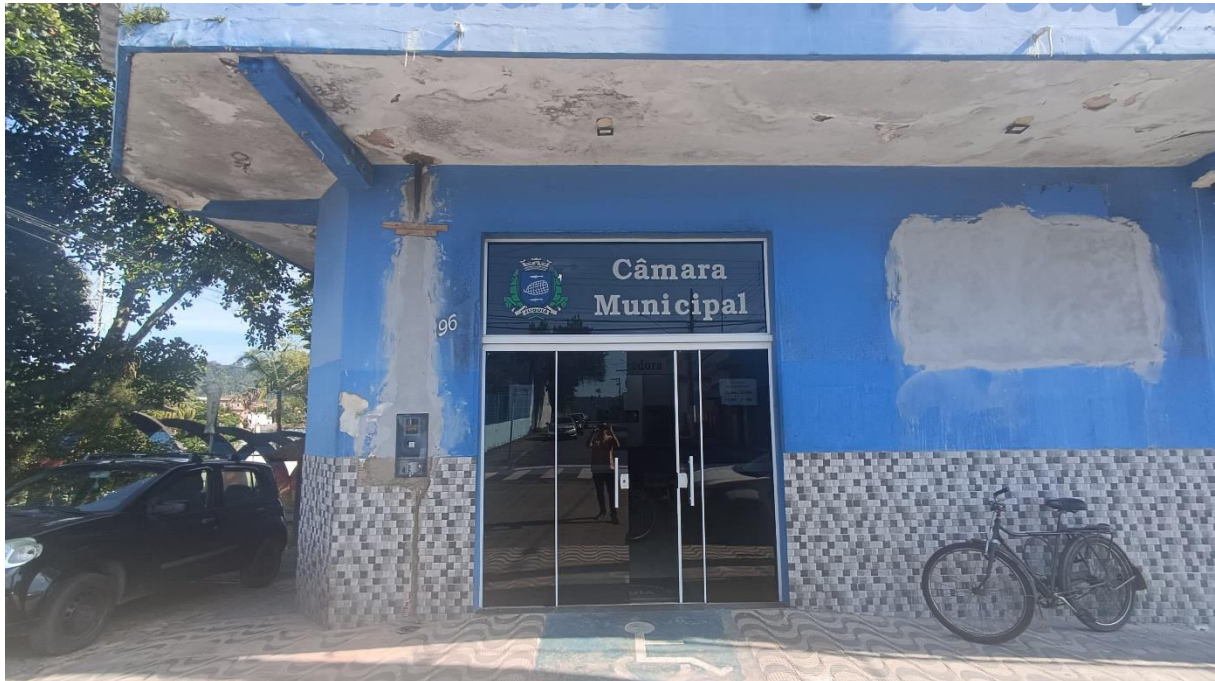
Imagem 3 - Área externa frontal e marquise