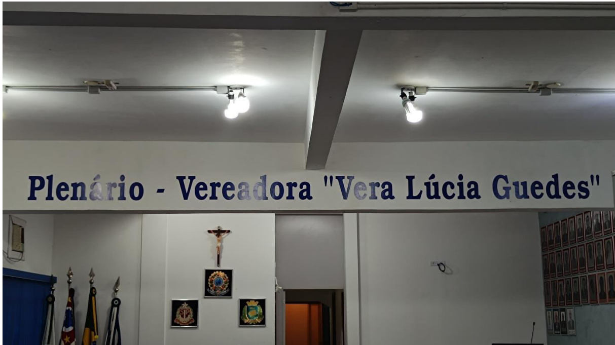
Imagem 5 - Área interna (Plenário)