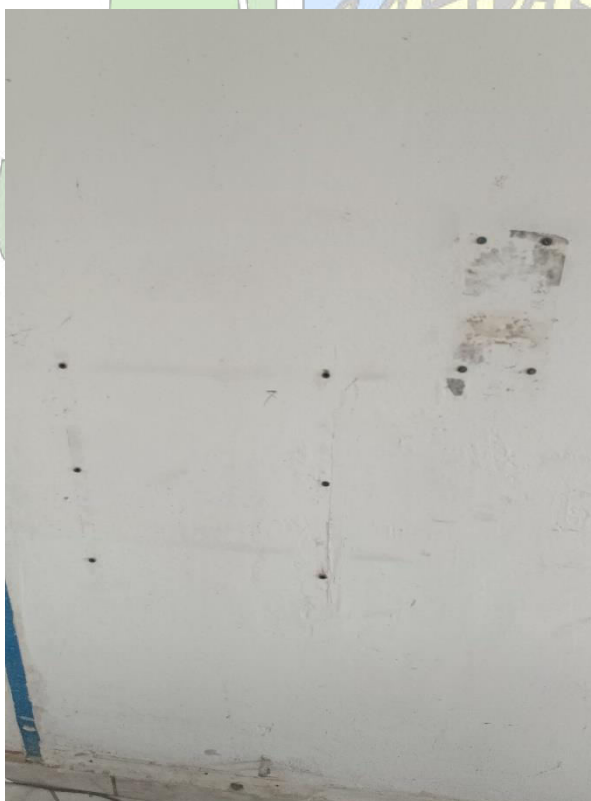
Imagem 10 – Área interna piso superior