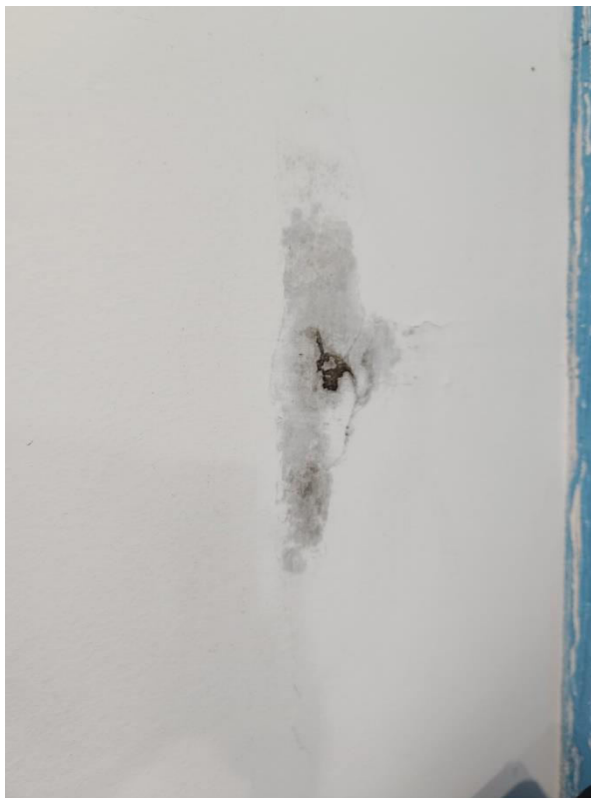
Imagem 8 – Área Interna (parede da Sala do Presidente)