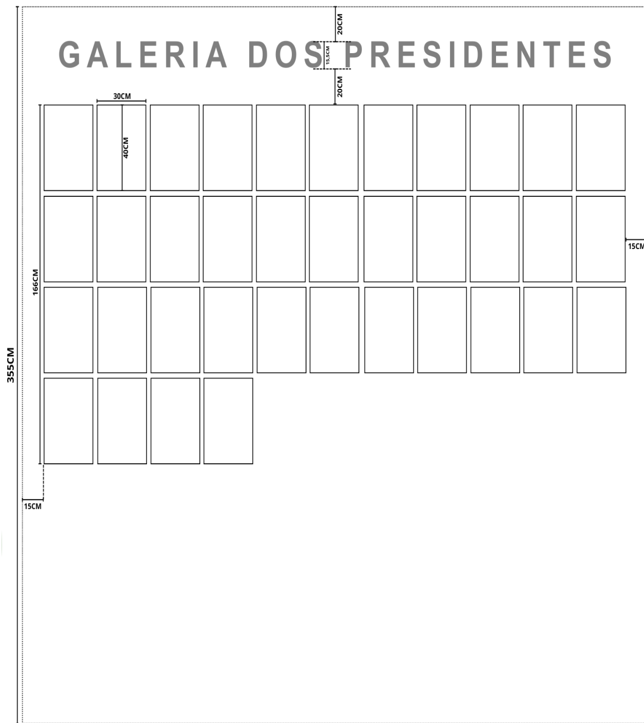
Figura 1 - Medidas a serem seguidas na execução do serviço.