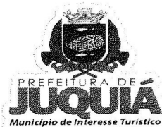
TABELA DE VENCIMENTOS ANEXO VIII