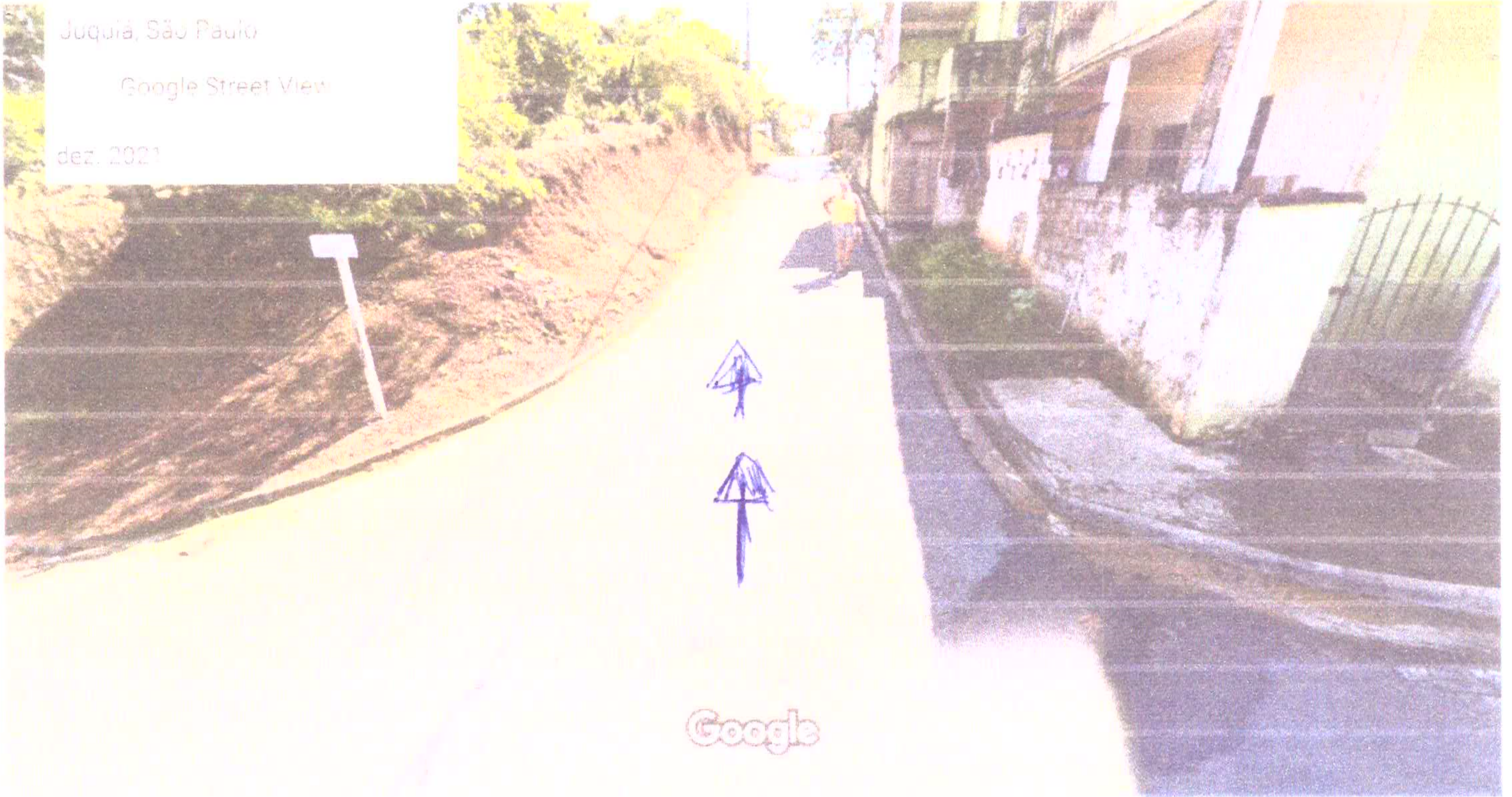
Captura da imagem: dez. 2021